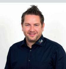
Andreas Frick Bau & Messebetrieb