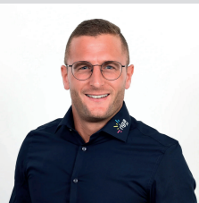
Marco Nägele Bau & Messebetrieb